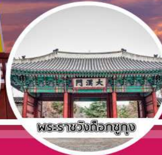
พระราชวังเคียงอกชุง