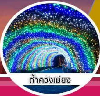
ต้าควังเมียง